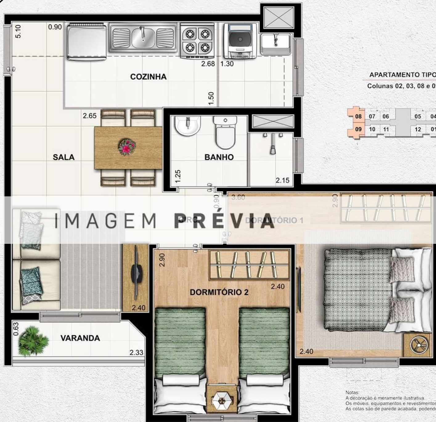
APARTAMENTO TIPO Colunas 02, 03, 08 e 09